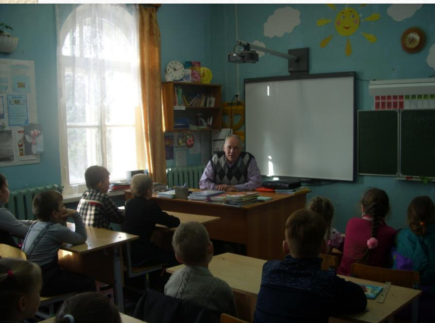
ГБУ “Краснохолмская СББЖ”