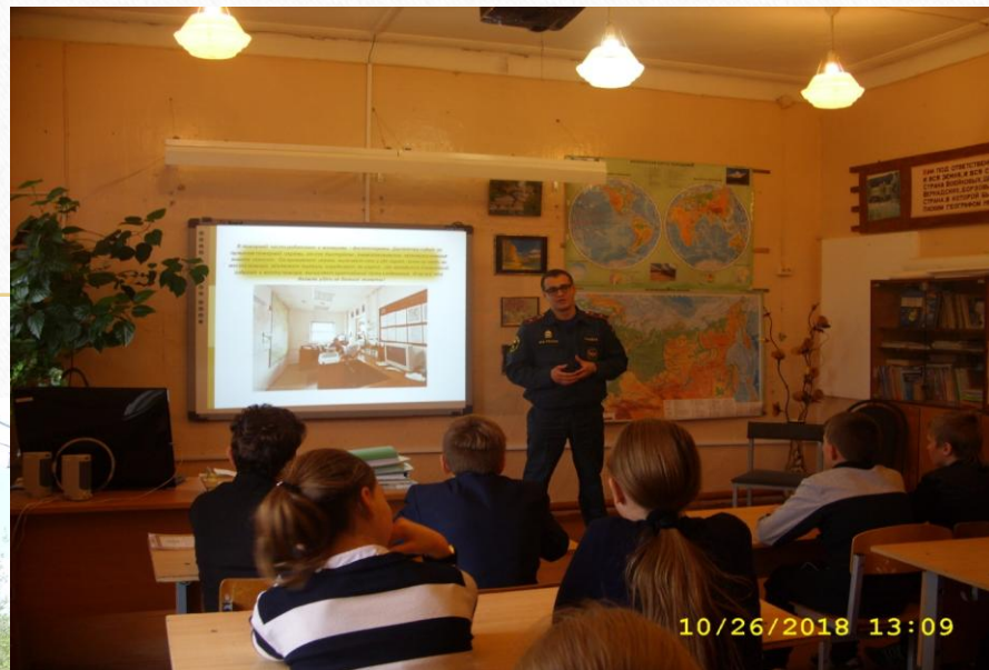
Сотрудники пожарной части